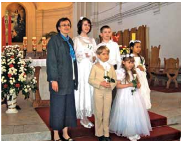
S prvoobhajanci v župnijski cerkvi Marije Vnebovzete v Sankt Peterburgu

Do prestrukturiranja je bilo v Karagandi in sploh v Kazahstanu veliko katolikov, večinoma potomcev Nemcev, Poljakov, Litovcev, tudi Ukrajincev, ki jih je Stalin dobesedno »vrgel« v stepto. Prvi so bili izgnanci iz 30-ih let prejšnjega stoletja, sledilo je še eno veliko izgnanstvo v 50. letih. Prve so pripeljali v