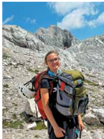
Angel varuh v podobi šerpe Tine