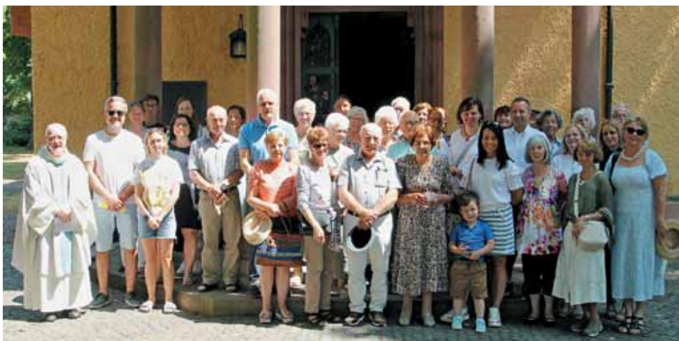
Eni v senci, drugi na soncu pred romarsko cerkvijo