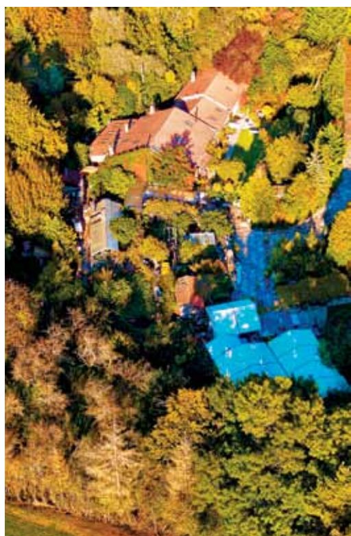
Mlin Thicourt iz ptičje perspektive