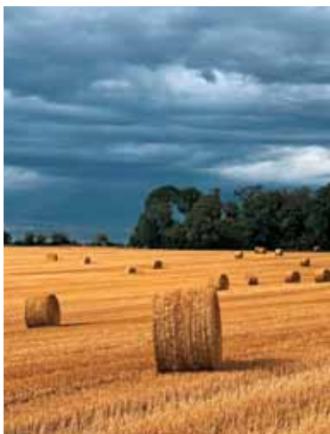
Vremenski posnetek iz neposredne bližine mlina.

Božje zgodovine, je čas naše angažirane večnosti, ki je hkrati pogled na začetek stvarjenja in v sebi nosi že kal večnosti. Biblično besedilo iz knjige Razodetja nas postavlja pred nosečo ženo. Noseča žena je nova Eva. Prva žena človeštva, žena, ki je rodila človeštvo in ki dobi pravi materinski