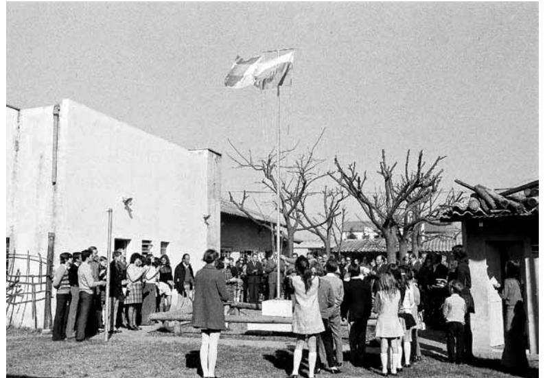
Pred vsako uradno prireditvijo se ob petju himn dvigne argentinska in slovenska zastava.