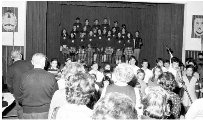
Pred oder so se postavili tudi otroci šole Josipa Jurčiča.