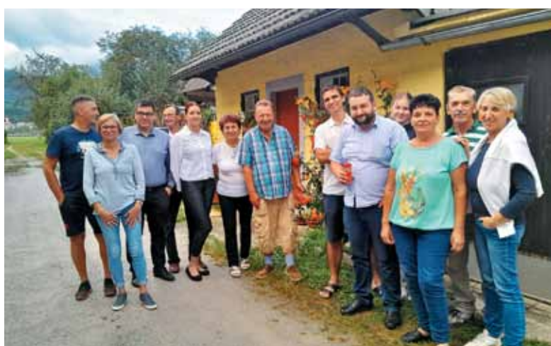
Ekipo Bellevue na domu Florjana in Janeza Praprotnika v mesecu avgustu 2023