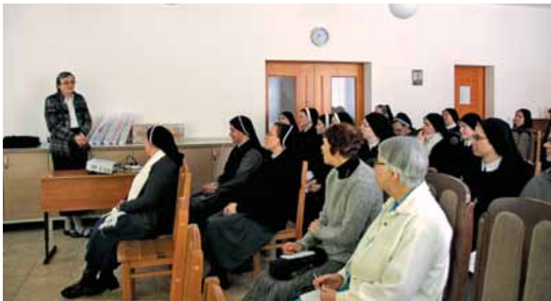
Predavanje za sestre škofije sv. Klemenca v Saratovu

država in so razdalje prav tako ogromne, danes to izobraževanje poteka večinoma po spletu. Po eni strani je to dobra rešitev, po drugi pa je živ stik s študenti tudi velik plus, če je le mogoče, vsekakor pa na tak način dosežemo mnoge, ki sicer ne bi imeli možnosti izobraževanja.