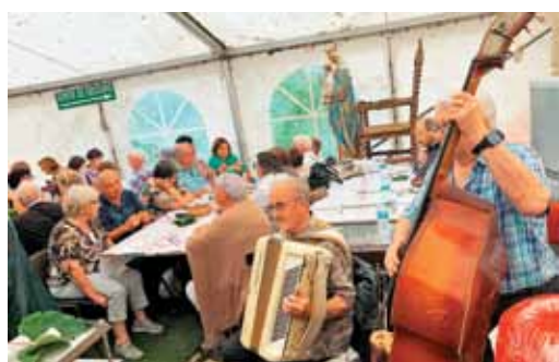
Ob zvokih domačih in tujih pesmi je prijetejš.