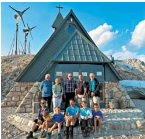
Švedsko-slovenski vzpon na Triglav – po sv. maši na Kredarici