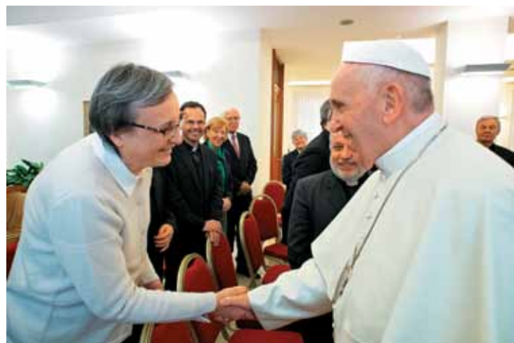
S papežem Franciškom v Hiši sv. Marte

Predavanja na Teološki fakulteti so sama po sebi dovolj velik zalogaj, skupaj z vsem, kar predpostavlja profesura. Zame so bili nekateri predmeti novi in ker so obsežni in je bilo dela s pripravo predavanj veliko. Ob tem pa je potrebno še kaj napisati, pripraviti kakšno predavanje, veliko trenutno delam tudi za novi dokument Mednarodne teološke komisije o teologiji stvarjenja in skrbi za stvarstvo. Vsekakor bi želela, kolikor mi bodo moči dopuščale, prispevati k izobraževanju bodočih duhovnikov, pa tudi laikov v Sloveniji.