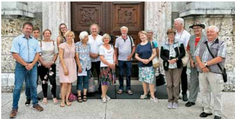
Po zahvalni sv. maši na Brezjah