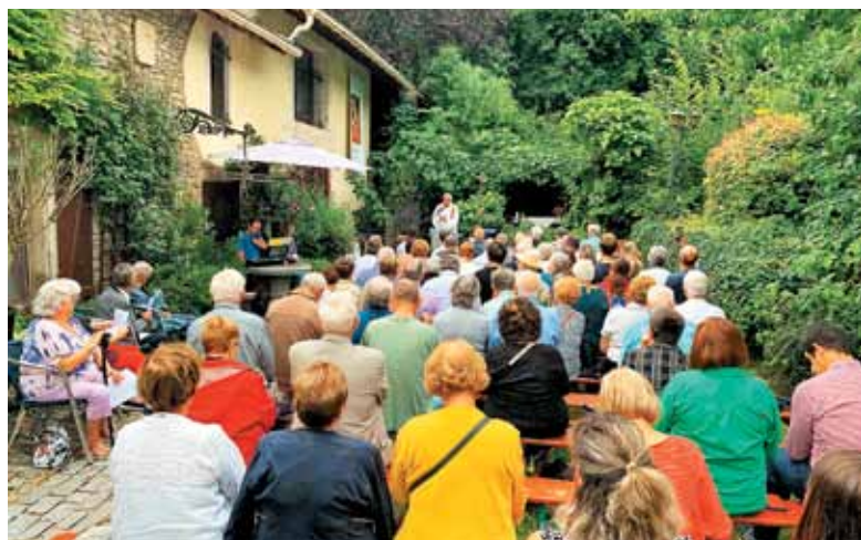
Maša v naravi je vedno lepo obiskana.

mi: »Vsi smo zaznamovani s časom. Iz roda v rod, iz veka v vek ... Marija je bila močno časovno zaznamovana. Čas njene zgodovine je tudi čas