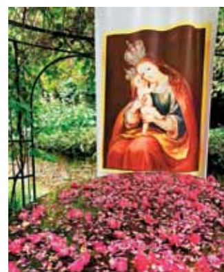
Mati Marija na tuje je šla ...