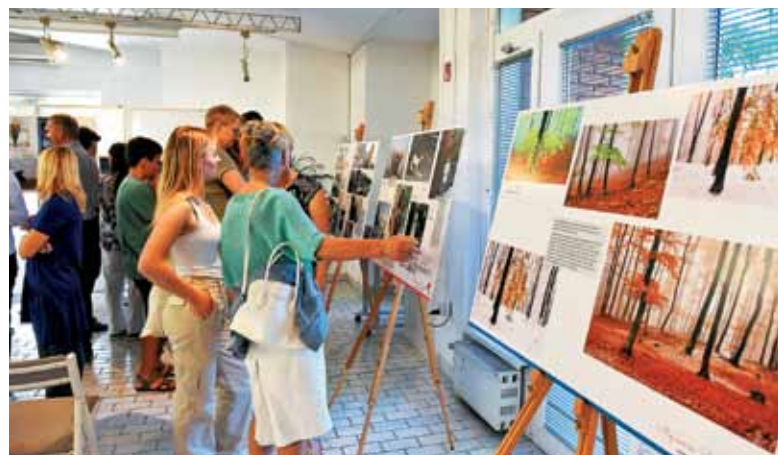
Po zaključku programa so se obiskovalci zadržali v prijetnem klepetu.