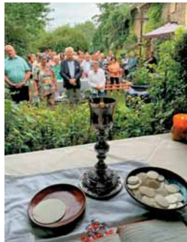
Kjer se Božje in človeško združi v eno.

Če smo se v juliju in začetku avgusta žgali na vročem soncu, je bil 15. avgust zopet v znamenju oblačnosti, grmenja in hujših nalivov ravno v času kosila. Ob 10. uri smo se približali oltarju s sedmimi ministranti in ministrantkami iz Spicherena. Po naši dolinici je lepo odmevala molitev kakor tudi pesem iz stoterih grl. Le