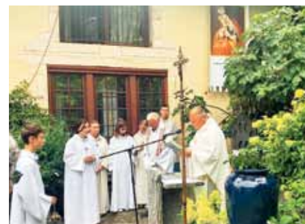
Ob oltarju je bilo tokrat kar šest ministrantov.