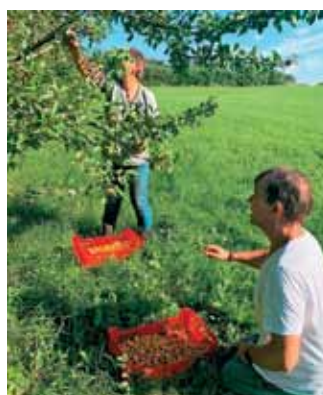
Tudi mirabele so pravočasno dozorele.