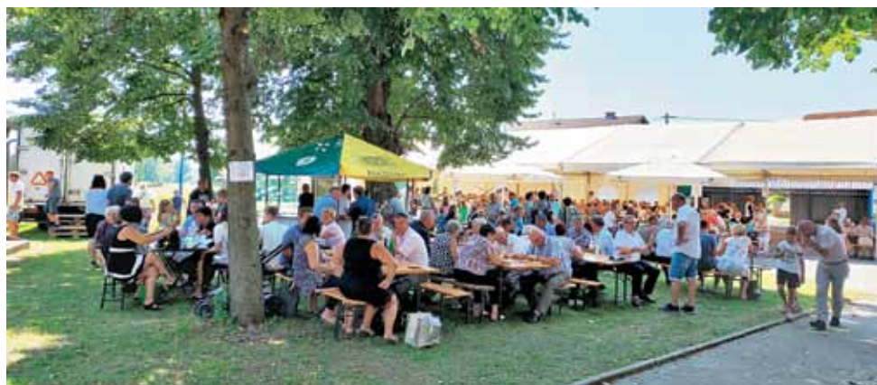
Sveta maša v Murskih Črncih 15. avgusta