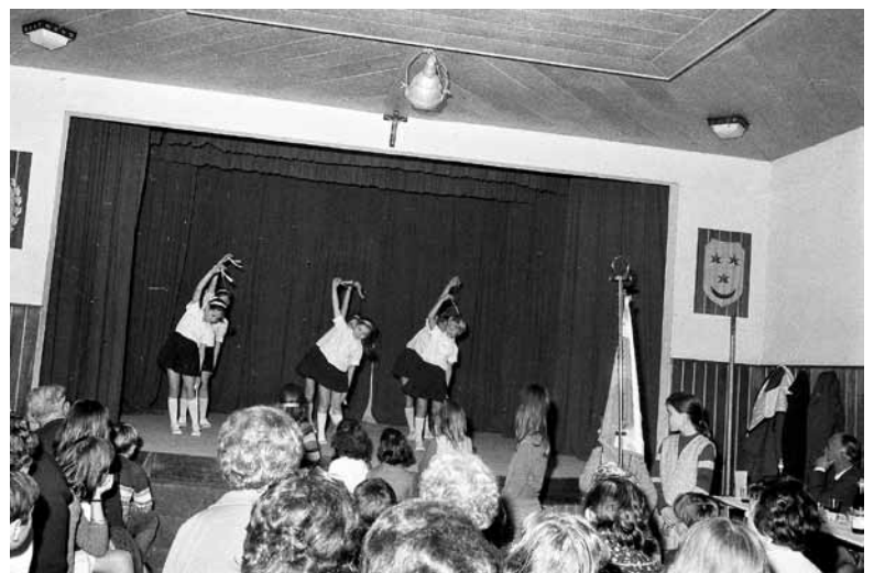
Deklice nastopajo z rajalno vajo.