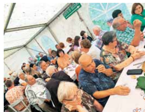
Delni pogled na romarje, ki čakajo na kosilo.