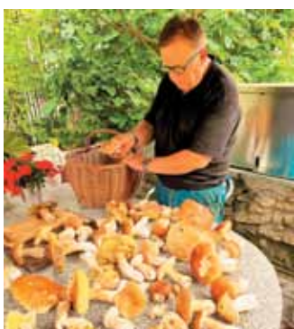
Pravšnji dodatek narave za romarsko kosilo.