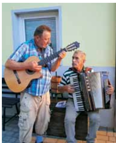
Na srečanju z ekipo Bellevue ni manjkalo veselja in glasbe.

odprlo nebo in prikazale so se steze Najvišjega, katerega iskreno in stalno prosimo za blagoslov in podporo.