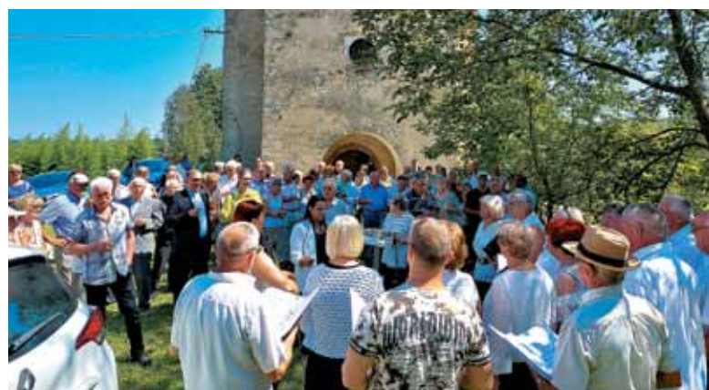
Druženje po maši pri pogostitvi