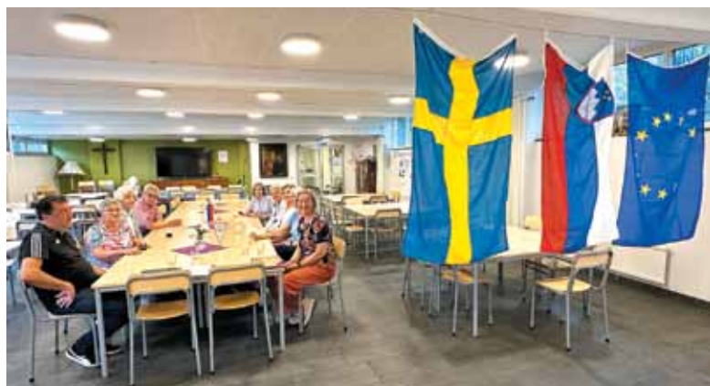
Dan državnosti v Göteborgu 2023