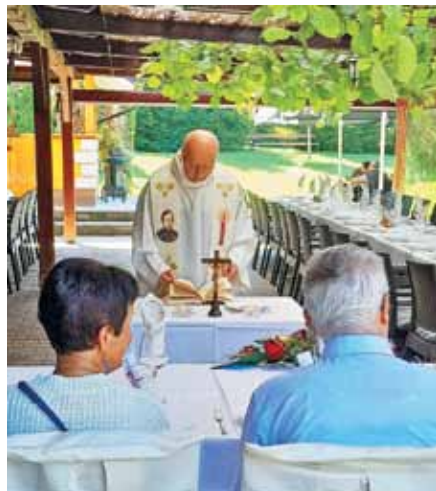
Tik pred začetkom obreda zlate poroke