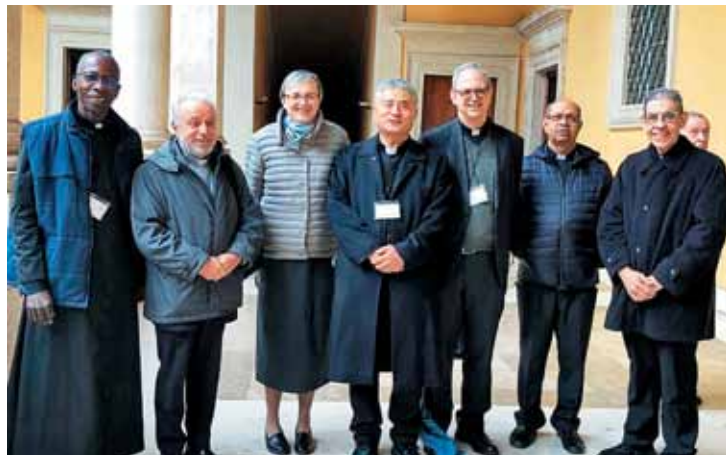
S kolegi iz MTK - november 2022

Verjetno je preobsežno, da bi lahko na kratko odgovorila. Sinodalnost je danes znamenje časa,