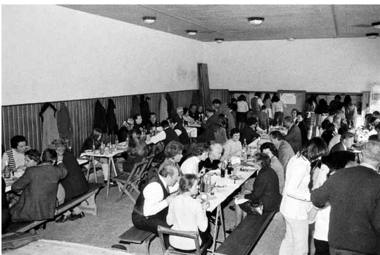
V slovenski skupnosti je bilo znano, da v domu pripravljajo okusno jedačo.