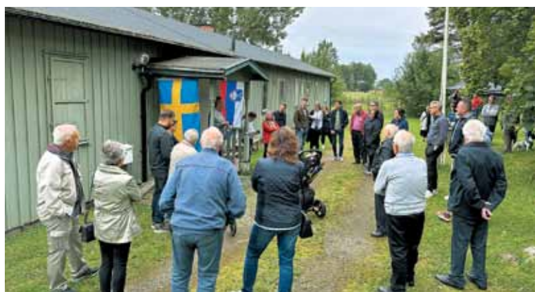
Srečanje vseh generacij v Köpingu avgusta 2023