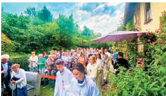
Temni oblaki nad nami se pno, ura je deset.