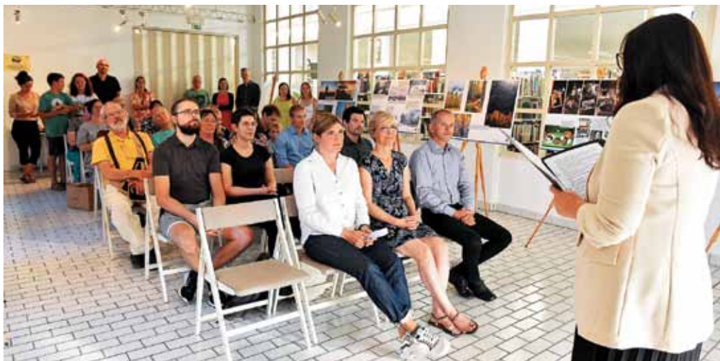
Odprtje v prijetnem ambientu razstavnega prostora Knjižnice Prežihovega Voranca