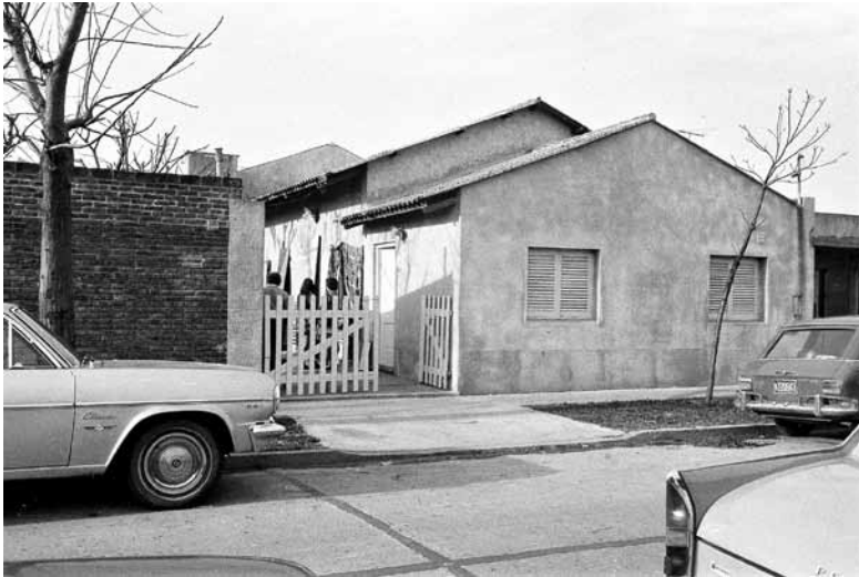
Takratno pročelje Slovenskega doma v Carapachayu

V fotoarhivu Rafaelove družbe so posnetki s 13. obletnice doma, ki je bila 20. maja 1973.