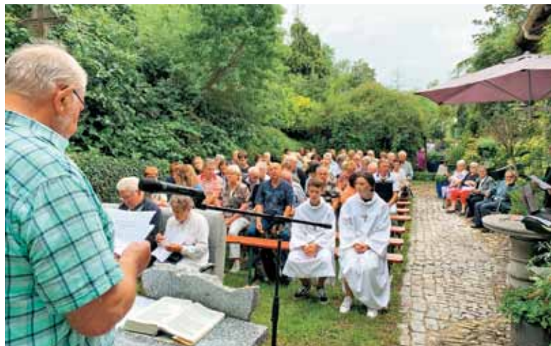
Laiki so tudi letos bogato sodelovali pri liturgiji.