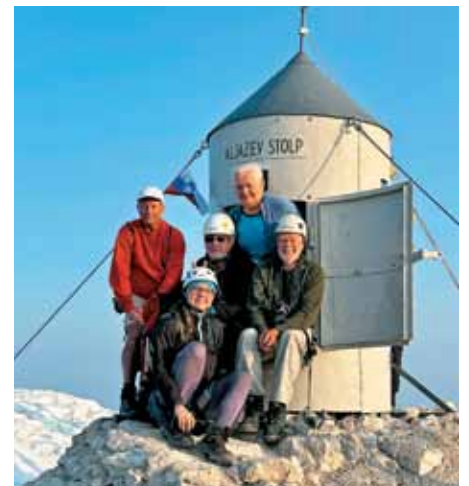
Pri Aljaževem stolpu