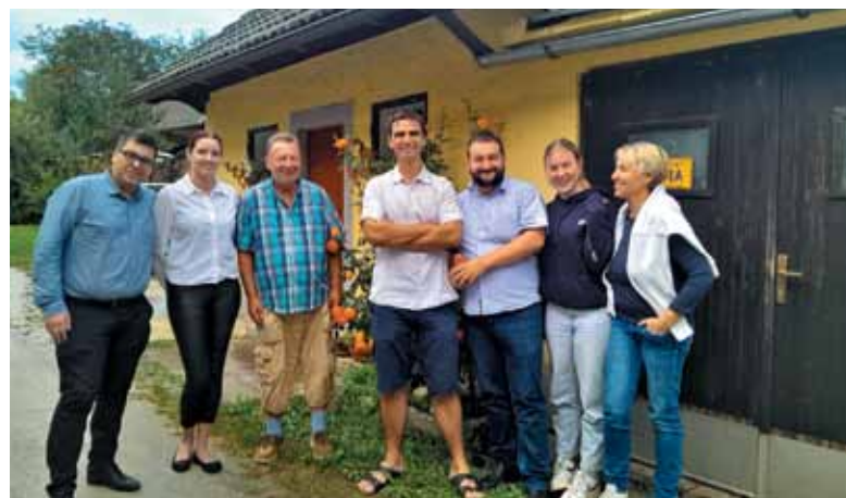
Zvesti SPC-jevci na srečanju v Sloveniji