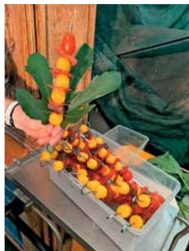
Tako je izgledalo slano aperitivno nabadalo