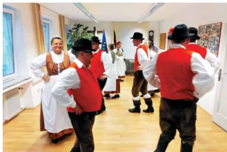
Ples folklorne skupine Drava