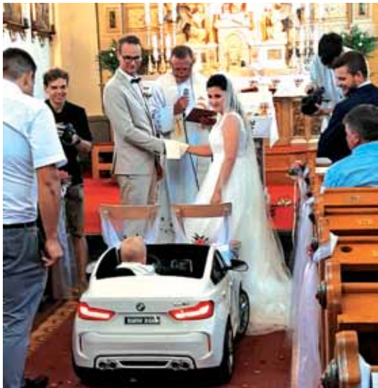
Med poročnim obredom je sin krščenec k oltarju pripeljal prstane za blagoslov.

prenovljene stavbe SPC v Bruslju. Pred odhodom nazaj v