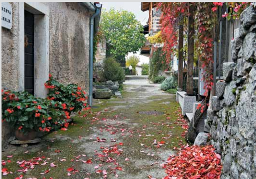
Jesenski Štanjel