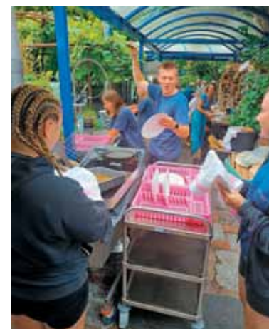
Ministrantje iz Spicherna so ob prepevanju pesmi pomivali posodo.

Ob 17. uri se nas je dobrih 50 zbralo k večerni Marijini pobožnosti. Bogu