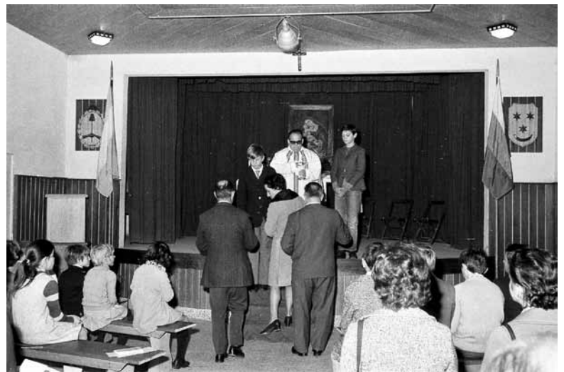
Verniki prinašajo darove na oltar.