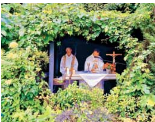
Oltar v naravi