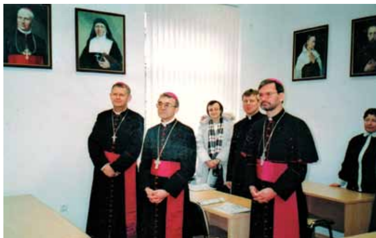
Ob blagoslovu knjižnice v semenišču