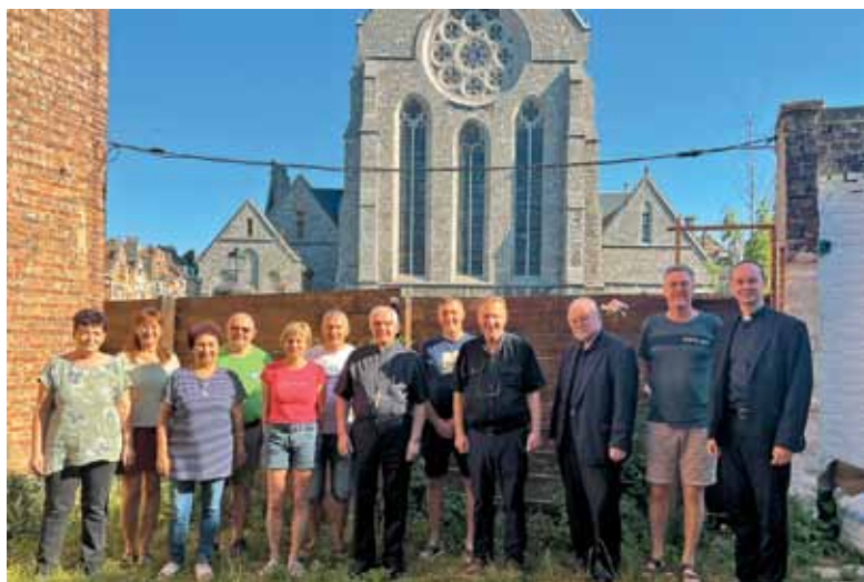
Ekipo Bellevue z nadškofom Zoretom na dan odprtja

Organizacija tako velikega dogodka, kot je bil blagoslov nove kapele in prenovljene stavbe Slovenskega pastoralnega centra v Bruslju, ni bila ravno preprosta. Potrebno je bilo misliti na toliko stvari, tudi na postrežbo okrog 250 udeležencev slavlja. Za to sta poskrbela pridna sodelavca