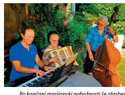
Po končani marijanski pobožnosti še glasbeni dodatek