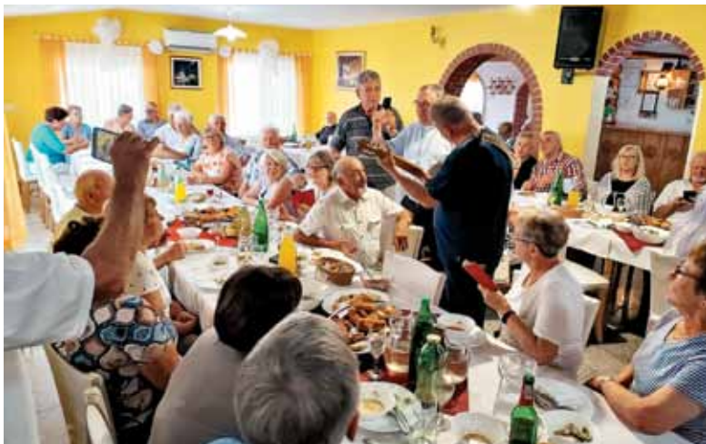
Srečanje pri kosilu