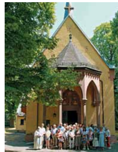
Romarska skupina pred cerkvijo v Maria Einsiedel

»Kaj naj postavim nasproti občutku krhkosti? Nezlomljivo zavest, da za narodno zvestobo na bivanjski borzi ni cene. In to ne samo iz poslušnosti nekemu kozmičnemu imperativu, ki diktira čas in prostor mojega obstanka, ampak tudi iz zavesti, da kot Slovenec nimam česa zavidati ko-