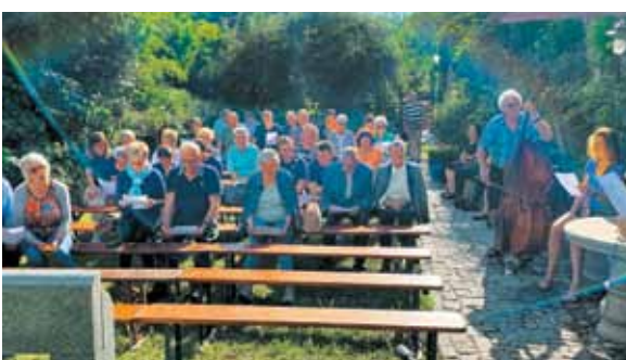
Ob 17. uri smo se ponovno združili v molitvi pred mlinom.